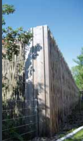
Støjskærm i tørret pil, for privat bygherre, i Flensborg.