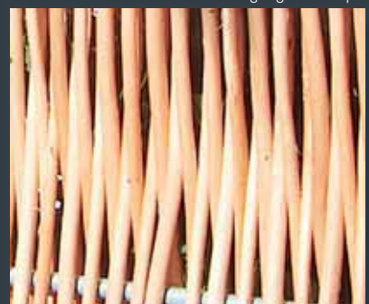
Kogt og afbarket pil.