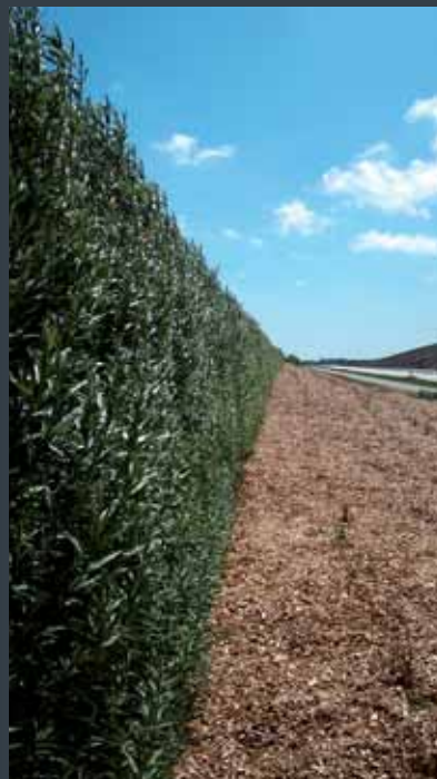
Støjskærm, DET GRØNNE ELEMENT®, i levende pil, sommer. For Væjdræktoratet.