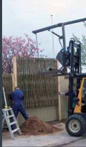
Støjskærm, montering af elementer.