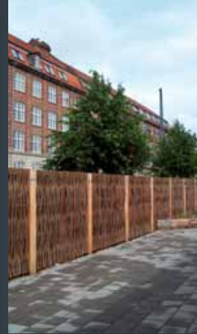
Støjskærm i tørret pil, netop monteret for Københavns Kommune.