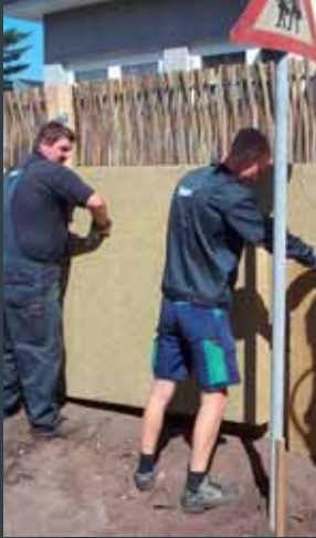
Støjskærm, montering af udi.