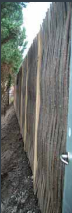
Støjskærm, monteret på snæver lokalitet ved stejle skrånninger.

DET GRØNNE ELEMENT® er igennem flere år blevet optaget i Vejdirektoratets Eksempelsamlinger. Desuden er flere projekter illustreret i Vejdirektoratets publikationer "Smukke Veje".