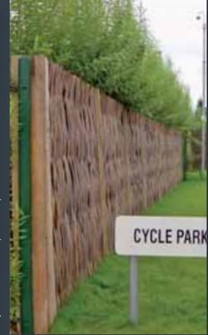
Støjskærm i levende og tørret pil, ved Retford Oaks Highschool.

Hegn og støjskærme bliver leveret og monteret i ind- og udland - både til private, industrielle og offentlige anlægsarbejder. Referencelisten tæller en lang række spændende projekter, ofte udviklet i samarbejde med rådgivende ingeniører, arkitekter og landskabsarkitekter, anlægsbranche og bygherre, heriblandt nogle af branchens mest krævende, eksempelvis: