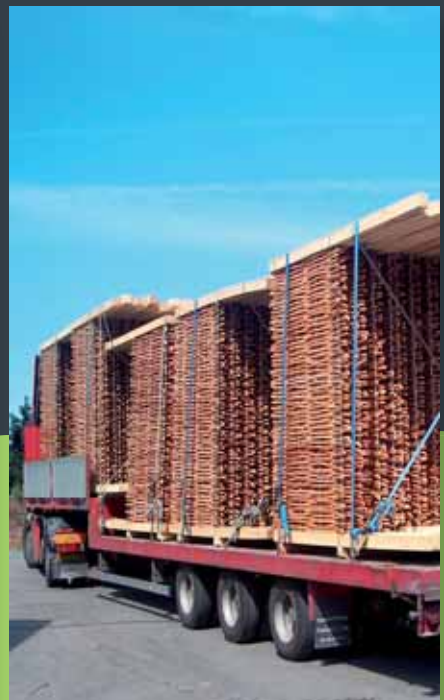
Eksport til UK af elementer til støjskærm.