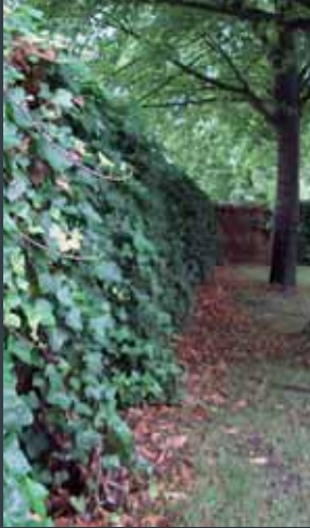
4 år efter montering, gåkket med vedbend, for Gladsaxe Kommune.