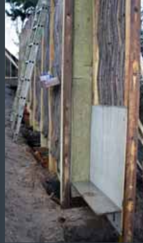
Støjskærm, med indbygget rottesikring.