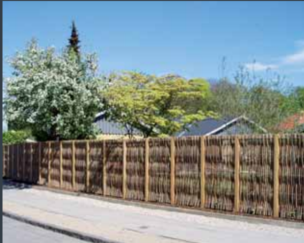
Vestkysthegnet, for privat bygherre.