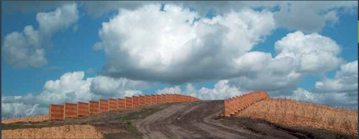
Faunapassage, hegn i afbarket pil, for Væjdræktoratet.

Piletræet udgør den bærende ide i PileBygs udvikling af hegn og støjskærme. Udvalgte pilesorter er forædlet og forarbejdet til 1.klasses mærkevarer, der alle fremstår med en flot finish og et eksklusivt look, straks efter færdig montering. Konceptet rummer en række forskellige designs i både levende og tørret pil for såvel hegn som støjskærme, og PileBygs design er præmieret med 'Den Danske Designpris, produktdesign det offentlige rum'.