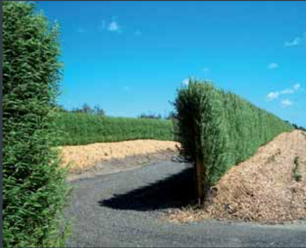
Støjskærm, DET GRØNNE ELEMENT® i levende pil, for Vejdirektoratet.