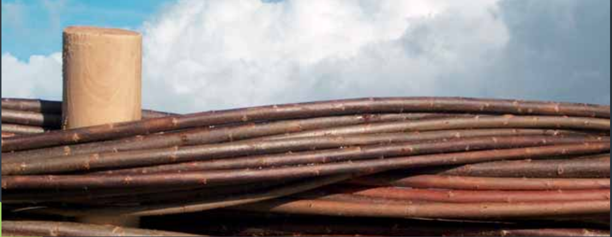
Detalje fra rundkørsel i tørrt pil, for Vedtrefektoratet.

Vi har ikke kun tradition for pil. Solidt og veludført håndværk er en selvfølge. Det samme er en miljøvenlig dyrkning af pil på vores hovedgårde i Nordjylland, samt omhyggelig rådgivning og hjælp til samarbejdspartnere og kunder. Et væsentligt præmis for vores arbejde er at respektere naturens egne materialer. Tørrede pil anbefales ikke behandlet, men derimod beplantet med stedsegrønne planter. Det sikrer en smuk og naturlig ældning, hvor et stadig mere naturligt vejr-