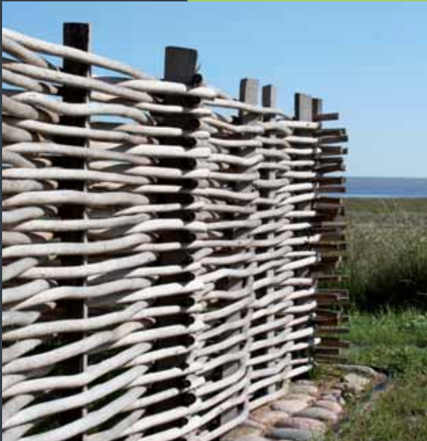
Hegn i afbarket pil, flettet ved feriecenter på Rømø.

Fornyelse er samtidig en del af vores hverdag. Land-art og nye forarbejdninger af pil udvikles løbende, og man er altid velkommen til at kontakte os med ideer til ny anvendelse af pil.