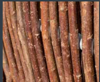
Ren, rå bark.