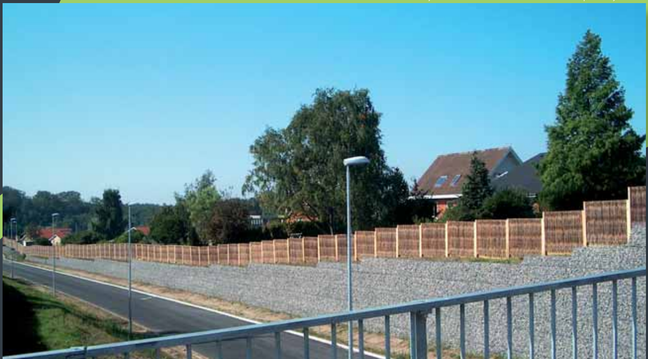
Støjskærm, DET GRØNNE ELEMENT® i tørret pil, for Fyns Amt.