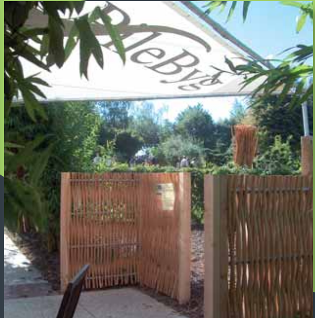
Vestkysthegn, i afbarket pil, fra PileBygs stand på Have-Landskabsmessen.