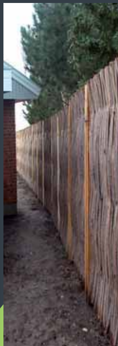
Støjskærm, monteret på snæver lokalitet ved beboelses/motorvej.