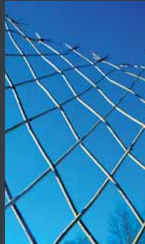
Harlekinhegn, leveres færdigflettet på rulle.