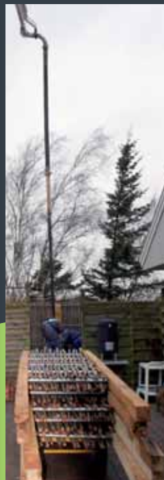
Støbning af punktfundamenter.