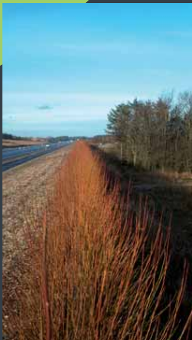
Støjskærm, DET GRØNNE ELEMENT®, i levende pil, vinter. For Væjdræktoratet.