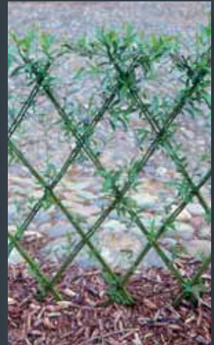
Harlekinhegn, 3 uger efter plantning fra PileBygs showroom.

Glem alt om byggemarkedernes spinkle pileflethegn eller tidskrævende 'flet-selv' løsninger. PileByg har specialiseret sig i at fremstille helstøbte og æstetisk set attraktive designløsninger; kendetegnet ved unik finish, stor styrke og lang levetid. Gennemtænkte hegnskonstruktioner, der ved levering er færdigflettede og komplette: Klar til nem og enkel opsætning.