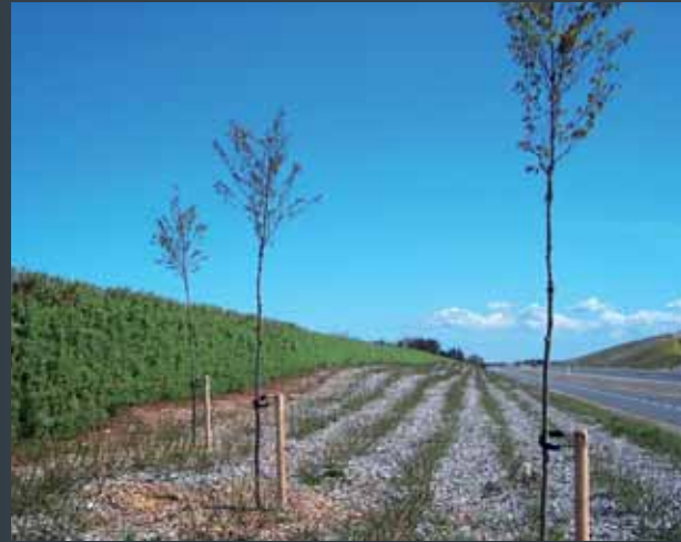
Støjskærm, DET GRØNNE ELEMENT® i levende pil, for Vejdirektoratet.

Hegn og støjskærme udgør betydelige visuelle indgreb, både i byen og det åbne land. Den rigtige løsning gør derfor en signifikant forskel. Piletræet har, igennem alle tider, hørt naturligt hjemme i vores landskab - og samtidig, været forarbejdet til mangfoldige anvendelser. Med afsæt i denne historiske tradition har vi udviklet hegn og støjskærme med nutidig funktionalitet og design. Gennemtestede og patenterede løsninger, hvor naturens form er udviklet til at møde tidens tekniske krav og formåen; relevante godkendelser og mærkninger.