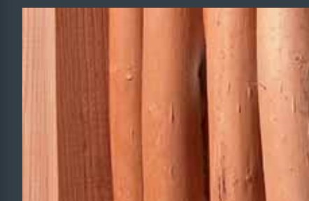
Der flettes over galvaniserede stålør, monteret direkte i forborede huller i endestolperne.

VESTKYSTHEGN med bark har en forventet levetid på op imod 15 år. Hegn i afbarket pil har længere levetid, idet pilen er kogt og afbarket. Den afbarkede pil ældes som hårdttræ, og bliver med tiden blank og stålgrå.