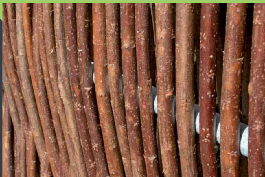
Førsteklasses pil i en rank og kraftig sortering - uden sideskud eller skader.

Pilen er enten nedtørret (traditionel pil med bark) - eller kogt og afbarket, før flettearbejdet udføres. Det sikrer, at pilen ikke 'tørres ind' på hegnen og bliver 'løst i flettet'. Alle kendte svagheder fra gængse pilehegn er således fjernet; også rundstokke i træ. I VESTKYSTHEGNET flettes i stedet over stålør, der er fæstnet i sidestolpen; det giver en meget stærk ramme.