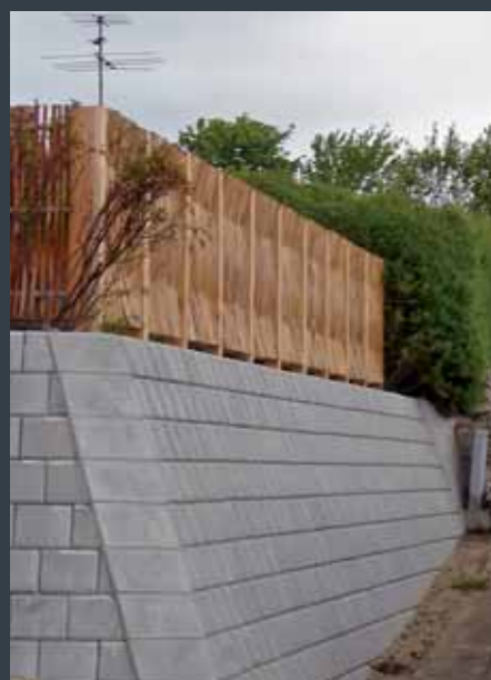
VESTKYSTHEGN i kogt og afbarket pil, ved privat bygherre.

Kombinationen af kraftige pilestammer, stål og lærketræ sikrer lang levetid og stringente linier - et betydeligt designmæssigt løft i forhold til gængse pilehegn.