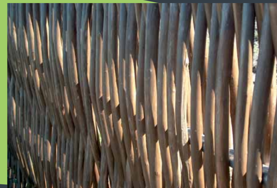
Flet med tørrede 2-3 årige pil, skal flettes over stål - ellers kan rammen ikke holde til spændet fra de kraftige stammer.

Alle hegn er udviklet og designet til at fremstå som naturhegn. Vi anbefaler derfor ikke behandling af hegnen. De kraftige materialer: stål, lærk og flerårige pil, sikrer hegnets lange levetid. Der leveres 1 vedbend sammen med hvert hegn i barked pil; stedsegrøn beplantning klæder de barked pil og forlænger hegnets levetid.