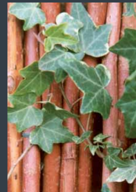
Når pilen ældes, står den stedsegrønne vedbend og de frønnede pilestammer smukt til hinanden.