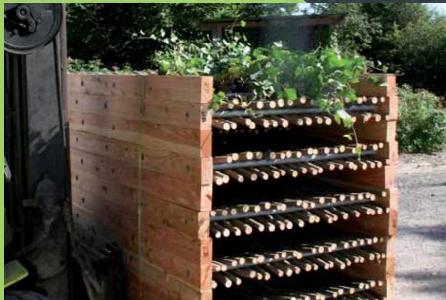
Hegn og vedbend på palle, klar til levering.

VESTKYSTHEGNET leveres i flet af 'pil med bark' eller 'kogt og afbarket pil':