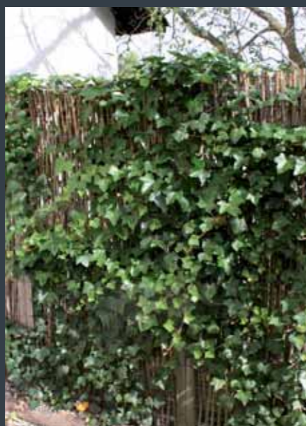
VESTKYSTHEGN i pil med bark og klatrende vedbend.