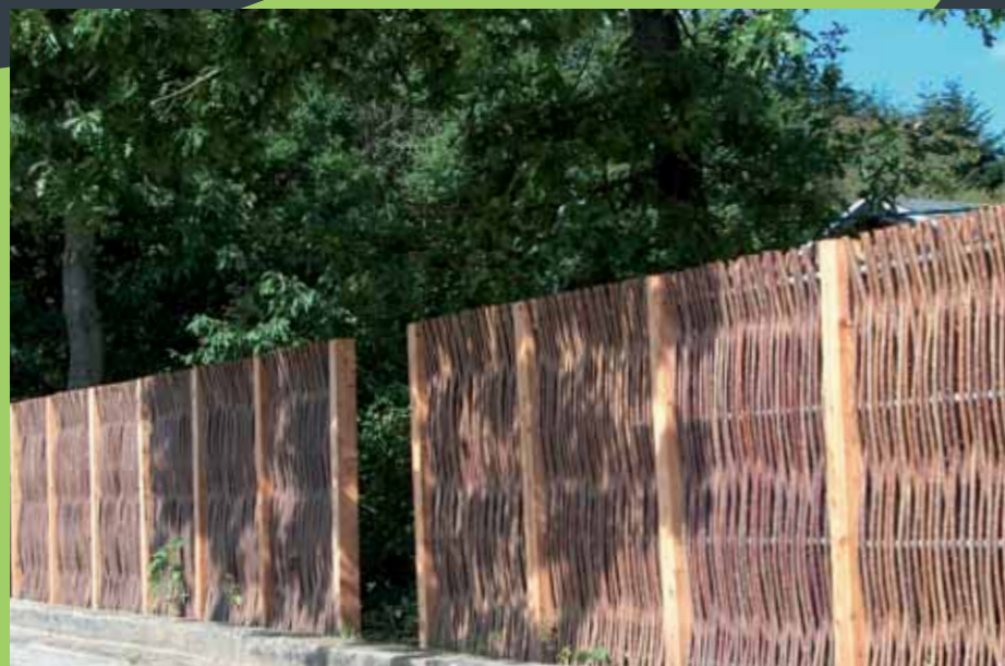
Afskærmning ved skolegård.

VESTKYSTHEGNET er designet til private haver og boliger. Et handy havehegn med unik finish; førsteklases kvalitet, udviklet med afsæt i det præmierede koncept DET GRØNNE ELEMENT®.