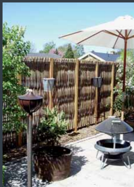
VESTKYSTHEGN opsat ved privat have.