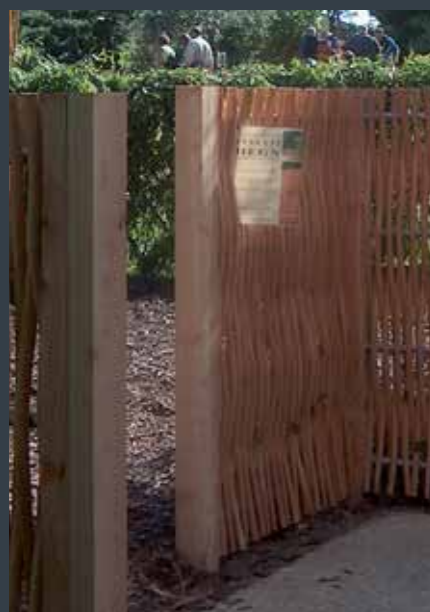
VESTKYSTHEGN i kogt og afbarket pil.

Stolperne måler 2" x 4", og færdigt monteret: "skulder ved skulder" - danner de en harmonisk 4"x4" stolpe. Derved opnås en flot visuel helhed i heget, uden "fremmed monteringsstolpe" til at forstyrre designets prioritering af henholdsvis pil og lærk.